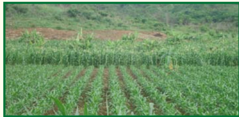
Mradi utawasaidia wakulima kuweza kutumia mbinu bora za kilimo pamoja na kilimo hifadhi

Mradi utawawezesha wananchi kuanzisha na kuendeleza shughuli mbadala za kujiongezea kipato ambazo ni rafiki wa mazingira. Baadhi ya shughuli ambazo wanajamii wataweza kunufaika nazo ni kama: