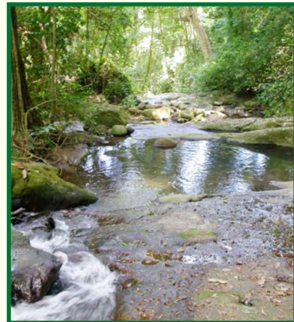
Misitu ya Milima ya Nguru Kusini ni chanzo muhimu cha maji kwa jamii inayoishi Wilayani Mvomero