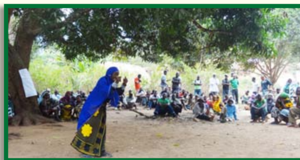
Wananchi wote wanatiwa moyo wakushiriki kwenye zoezi la maandalizi ya matumizi bora ya ardhi