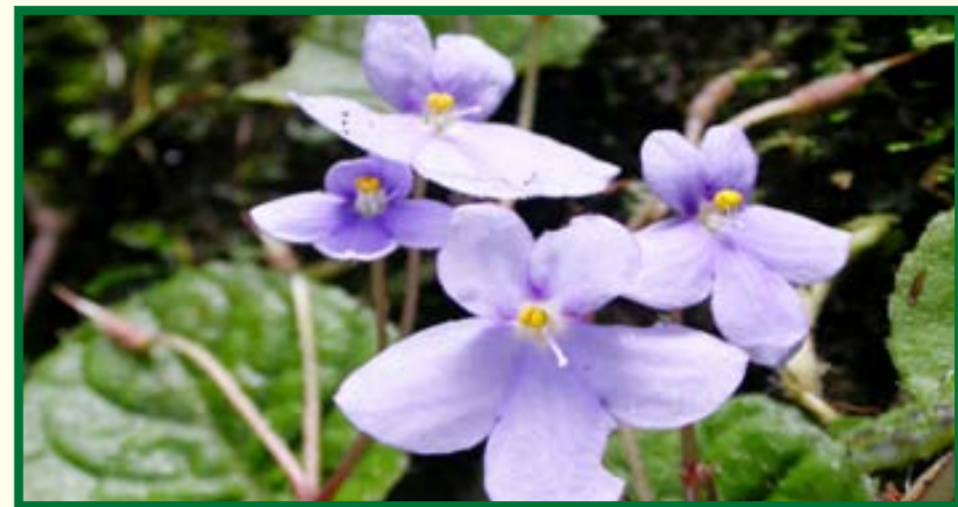
Misitu ya Milima ya Nguru Kusini ni nyumbani mwa wanyama na mimea adimu ambayo haipatikani mahali pengine popote duniani.

Mfumo huu wa usimamizi wa pamoja wa msitu unatoa fursa kwa jamii kuingia mkataba na serikali kuu kuweza kusimamia misitu kwa pamoja ili kuboresha misitu na pia wanajamii kunufaika kutokana na misitu hii. Wanajamii watafaidika na mgawanyo wa mapato kutokana na utaratibu huu, hivyo kupata fedha kwa ajili ya maendeleo ya kijiji na jamii kwa ujumla.