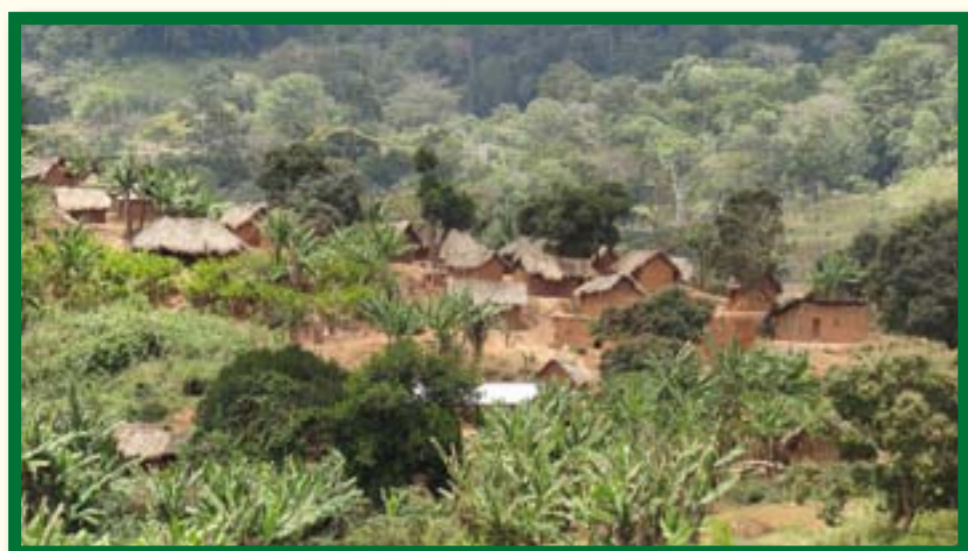
Mradi unasaidia vijiji 31 kuboresha ardhi na utawala bora wa rasilimali asilia

Mradi huu unatekelezwa kwa ubia kati ya Shirika la Kuhifadhi Misitu ya Asili Tanzania (TFCG), Mtandao wa Jamii wa Usimamizi wa Misitu Tanzania (MJUMITA), Halmashauri ya Wilaya ya Mvomero na Wakala wa Huduma za Misitu Tanzania (TFS).