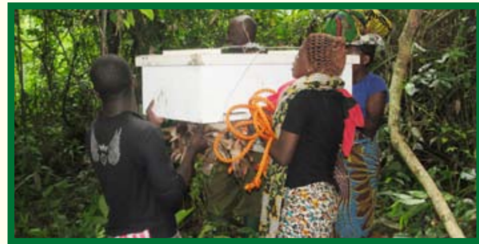
Mradi unatoa mafunzo kwa wanawake na wanaume ili waweza kupata kipato kutokana na kuuza asali na nta

AFYA NZURI NI MSINGI ILINDE FAMILIA YAKO NA VIRUSI VYA UKIMWI