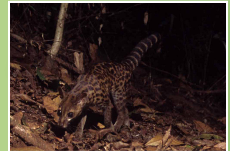
Kanu ya Lowe (Lowe's servaline genet) anaishi kwenye misitu michache ya Tanzania. Mnyama huyu yuko kwenye tishio la kutoweka kutokana na ufyekaji wa misitu na uwindaji. Ukimuondoa popo, kuna aina tofauti ya wanyama wanyonyeshao wasiyo pungua 31 kwenye misitu hii