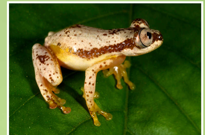
Aina mpya ya Chura . Aina hii adimu ya chura haijawahi kutambuliwa na wanasayansi wowote mpaka timu ya wataalamu kutoka TFCG na MJUMITA walipotembelea eneo hilo. Chura huyu amegundulika kutoka kwenye eneo la msitu mdogo ujulikanao kama Mikuvi ambao ni sehemu ya msitu wa hifadhi wa Kijiji cha Kisongwe. Ili aina hii ya chura iweze kuishi, ni muhimu kuhakikisha msitu huu unahifadhiwa.