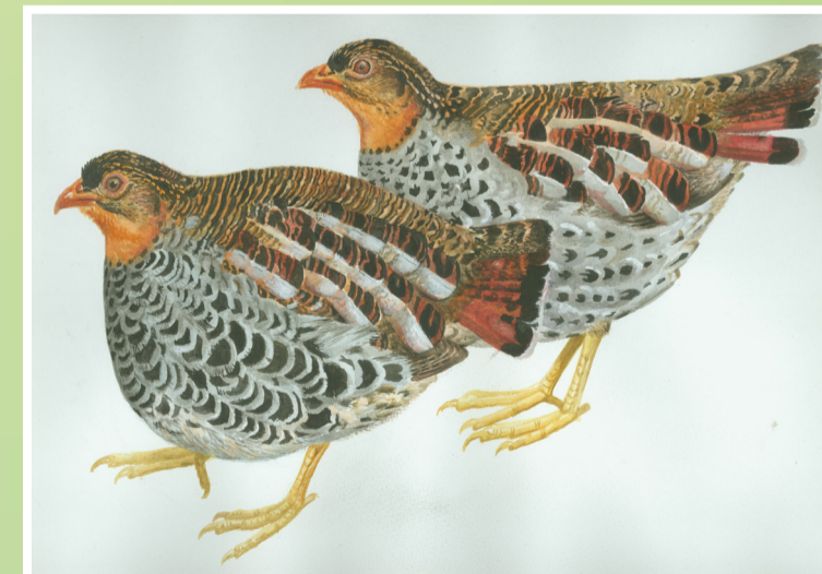
Kwale wa Rubeho ni aina ya ndege adimu sana ambaye anapatikana kwenye misitu ya Milima ya Rubeho tu na hapatikani sehemu nyingine yoyote duniani. Kwa kuwa wako wachache sana dunia nzima ni muhimu watu wasiwawinde na kuwaua. Pia kuna aina ya ndege wasiopungua 78 katika misitu ya milima ya Rubeho.