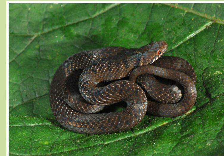
Nyoka ya msitu wa Uluguru , anapatikana katika Milima ya Tao la Mashariki pekee. Alipatikana hivi karibuni katika msitu wa Ilole.