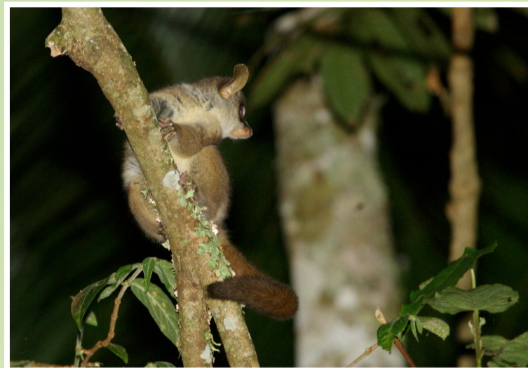
Komba wa Mlimani anapatikana kwenye misitu iliyoko kwenye Milima ya Rubeho. Ni aina adimu na yupo kwenye tishio la kutoweka kutokana na uharibifu wa misitu hii. Anakula wanyama wadogo na gundi itokanayo na miti. Komba huyu hufanya shughuli zake usiku na kulala mchana.