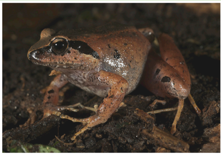
Nike's squeaker ni aina ya chura ambaye anaishi kwenye misitu ya Milima ya Rubeho tu. Ni adimu sana na anahitaji misitu iliaweze kuishi.

Ni muhimu kwamba MKUHUMI unatekelezwa kwa njia ambayo itasaidia kuhifadhi mimea ya asili na wanyama wanaopatikana kwenye misitu ya Tanzania. Jamii inaweza kupata malipo makubwa zaidi kutokana na MKUHUMI kama misitu inaviumbe adimu. Wanyama na mimea yote wanaoonekana kwenye bango hili wanapatikana kwenye ardhi ya vijiji vilivyoko kwenye milima ya Rubeho na Ukaguru na viko ndani ya eneo la utekelezaji wa mradi wa MKUHUMI.