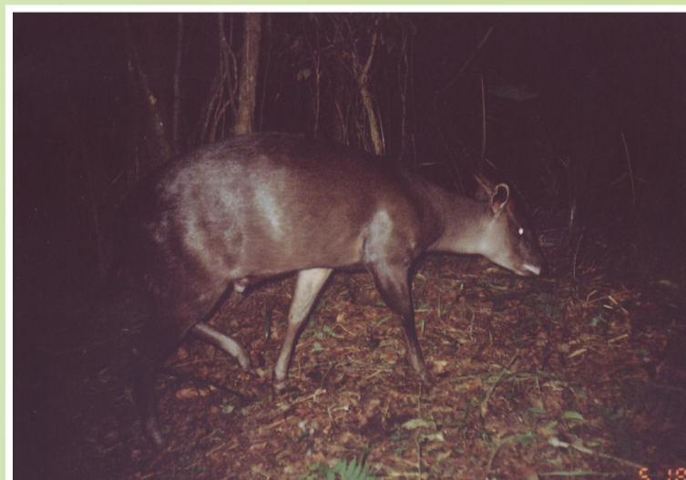
Minde ni funo wa msituni ambaye yuko kwenye tishio kubwa kutokana na uwindaji. Anapatikana kwenye misitu michache ikiwemo ya milima ya Rubeho. Kwenye baadhi ya misitu ya Tanzania ambapo walikuwa wanapatikana kwa wingi, kama Tanga, wametoweka kabisa kutokana na uwindaji na uharibifu wa msitu.